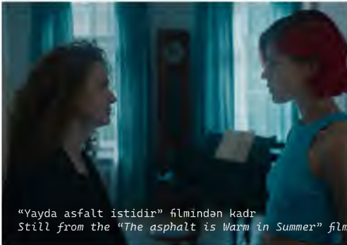
"Yayda asfalt istidir" filmindən kadr Still from the "The asphalt is warm in summer" film

Scriptwriter of feature films and series of Azerbaijani and Russian production - "Baku, I love you", "Train called - time", "Mothers of Champions", "16+", "The asphalt in summer is warm" (this script won the financial support of the Russian Ministry of Culture in 2021). Her scripts have won several grants in Azerbaijan and Russia.